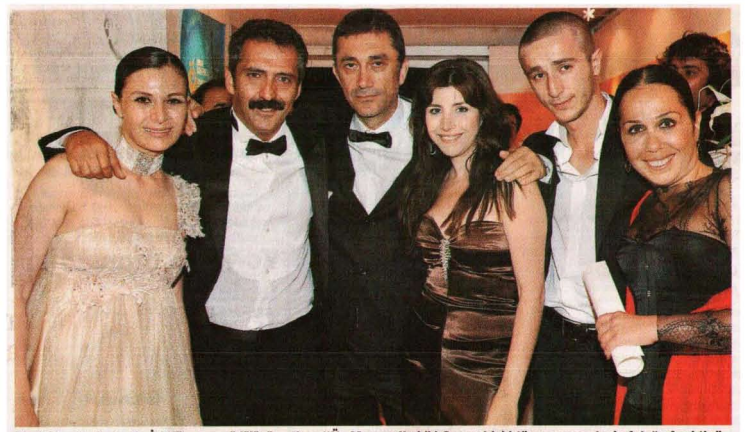
Nuri Bilge Ceylan'a En İyi Yönetmen ödülünü getiren "Üç Maymun" ekibi Cannes'daki tören sonrası toplu fotoğraf çekti.