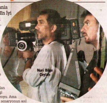
Nuri Bilge Ceylan