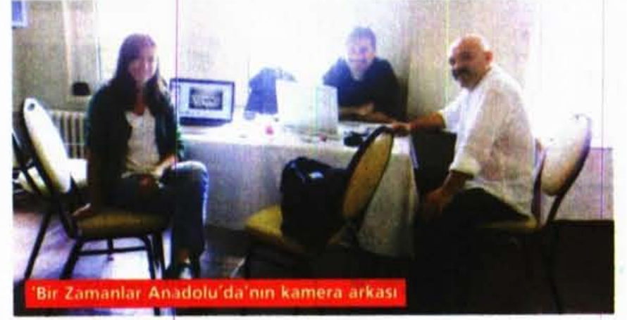
'Bir Zamanlar Anadolu'da'nın kamera arkası